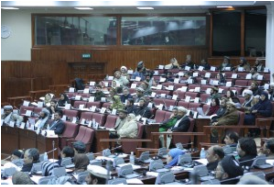
Afghanisches Parlament

Aber die Wahlen waren mehr: es ging um eine – zumindest mentale – Roadmap für einen Übergang in verschiedenen Bereichen, hin zu mehr Sicherheit und Stabilität. Eine transparente Wahl hätte die Basis gelegt für eine Einheit der unterschiedlichen Volksgruppen Afghanistans und wäre ein Startschuss für die Entwicklungsagenda des Landes gewesen.